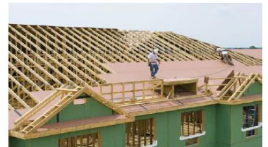
Twati ak Etaj Anba